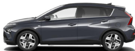
Aurora Gray Pearl